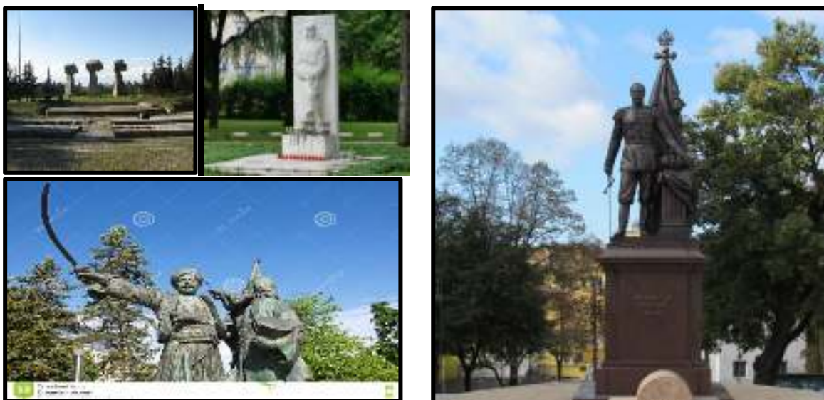
Памятники освободителям Сербии, Памятник Николаю II русскому царю